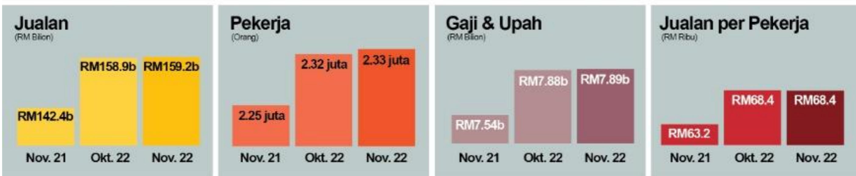
Jualan bagi sektor Pembuatan, Okt. 2021 - Nov. 2022 (% perubahan)

Nilai jualan Pembuatan meningkat 11.8 peratus kepada RM159.2 bilion pada November 2022 Seramai 2.33 juta orang pekerja dalam sektor ini dengan gaji dan upah dibayar berjumlah RM7.89 bilion